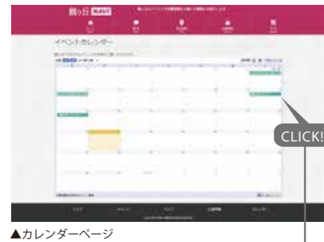
▲カレンダーページ

カレンダーページにはGoogleカレンダーを埋め込み、近々開催されるイベントをご確認いただけます。カレンダー上のイベント名をクリックすると吹き出しで、イベント情報が表示されます。